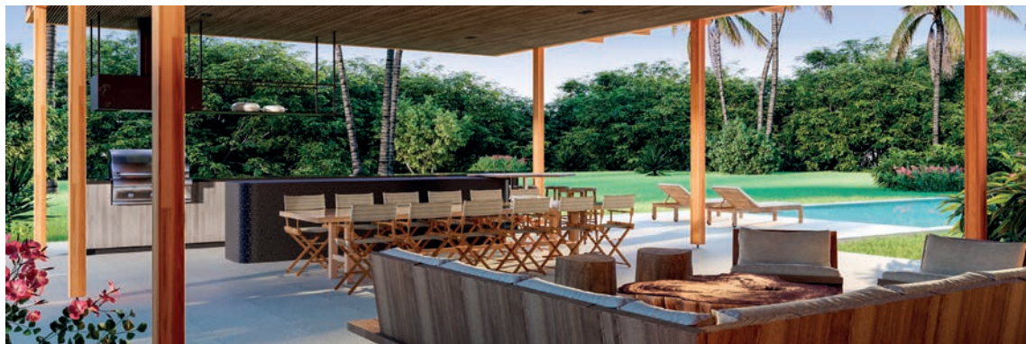
Ilustração artística do espaço gourmet com vista para a piscina