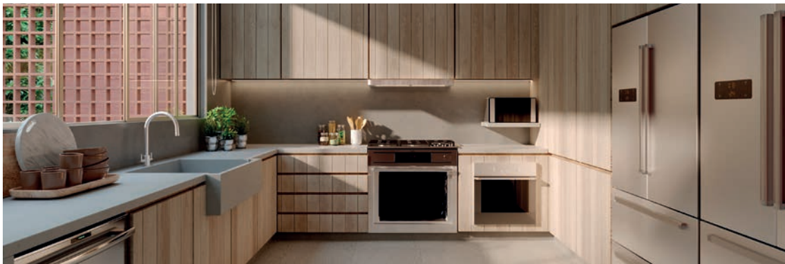
Ilustração artística da cozinha