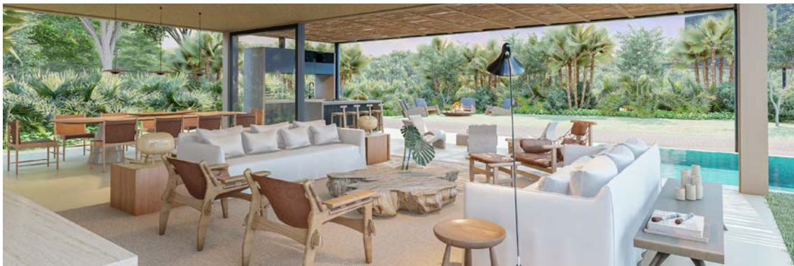
Ilustração artística da vista interna do espaço gourmet