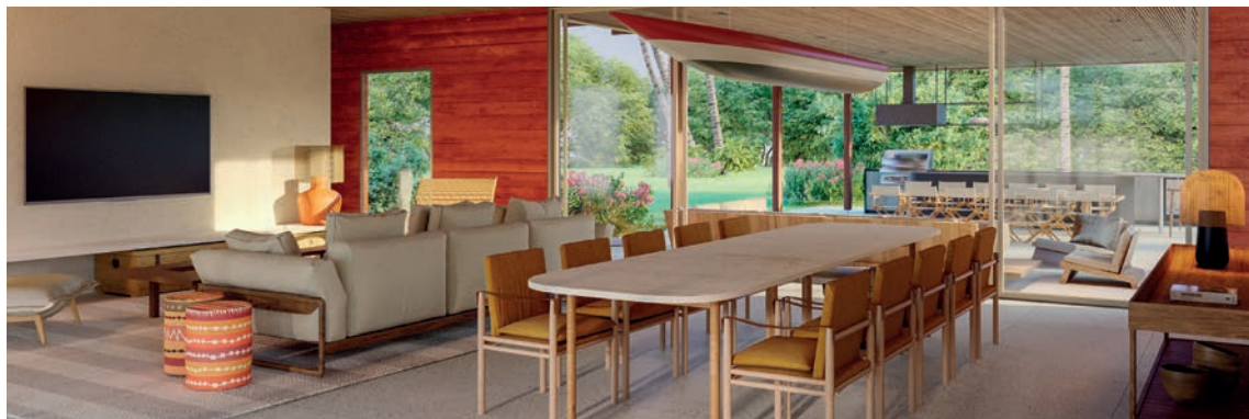
Ilustração artística do living no piso térreo