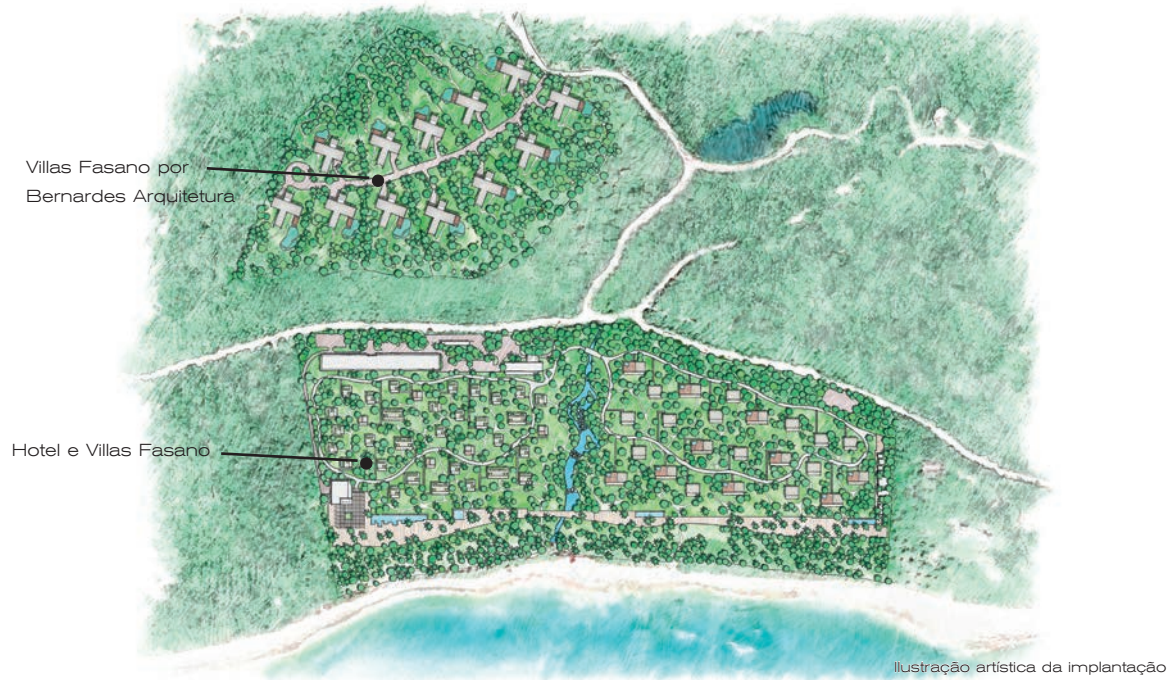
Ilustração artística da implantação

integra a área de estar, ao jardim e à piscina. No andar superior, a área de estar se prolonga até a piscina do deck, tornando-se um convite para a contemplação da vista.