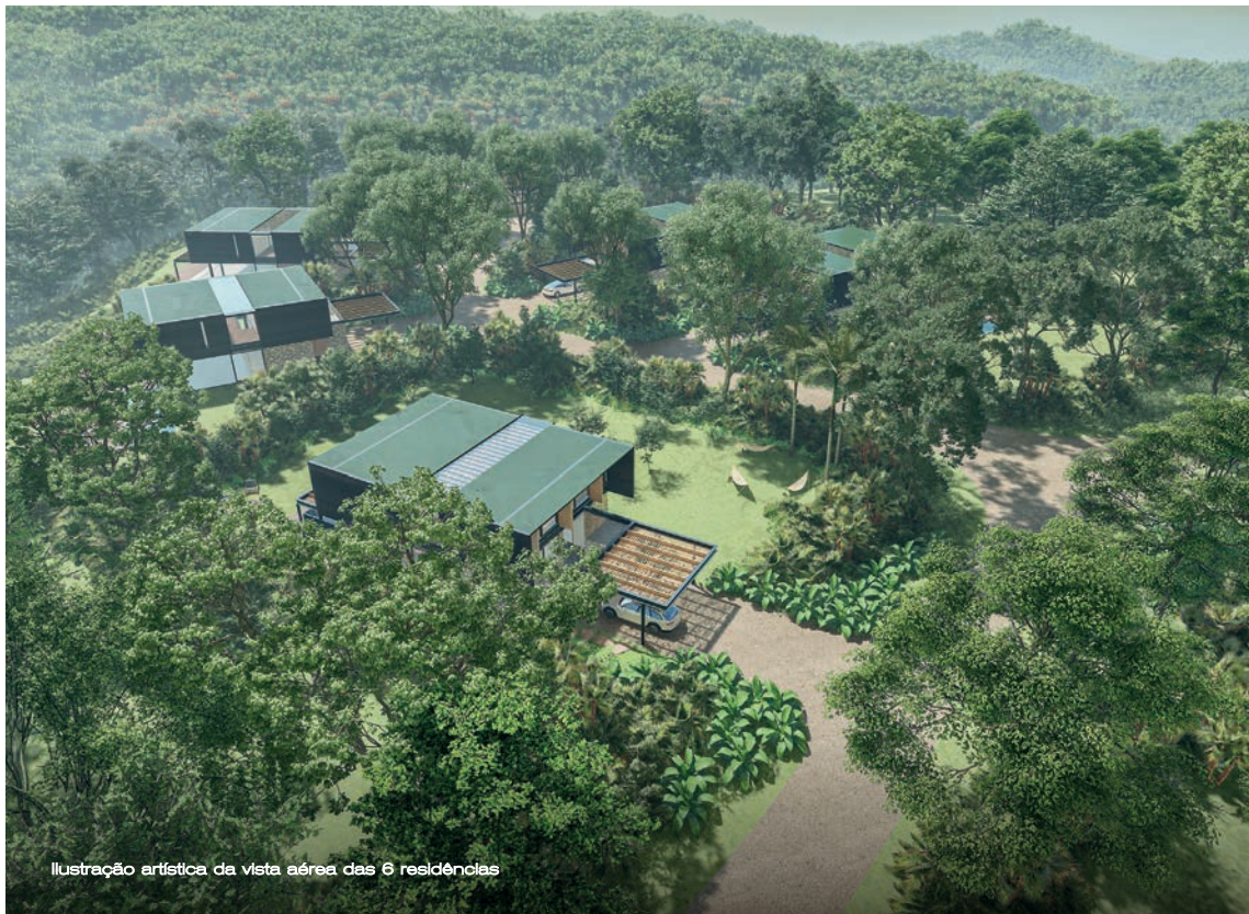
Ilustração artística da vista aérea das 6 residências