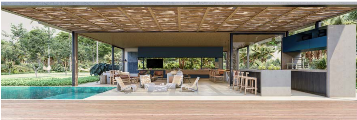
Ilustração artística da vista lateral do espaço gourmet