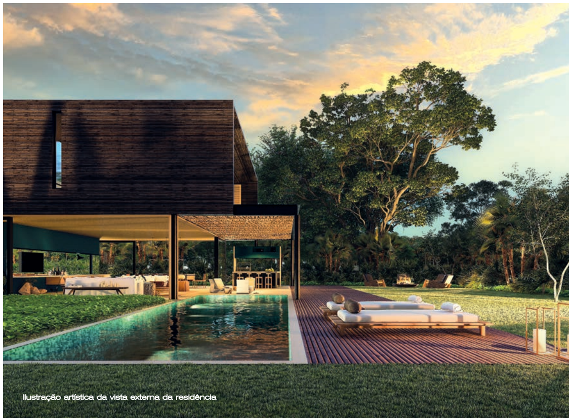
Ilustração artística da vista externa da residência