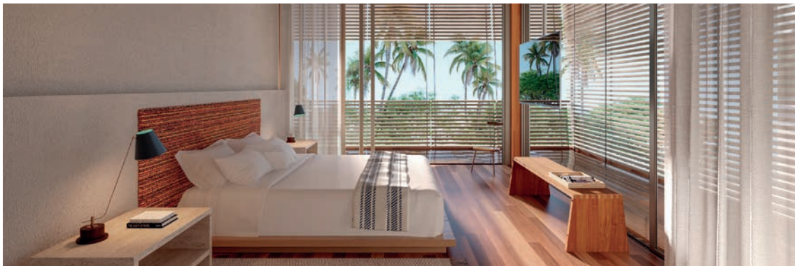
Ilustração artística da suite