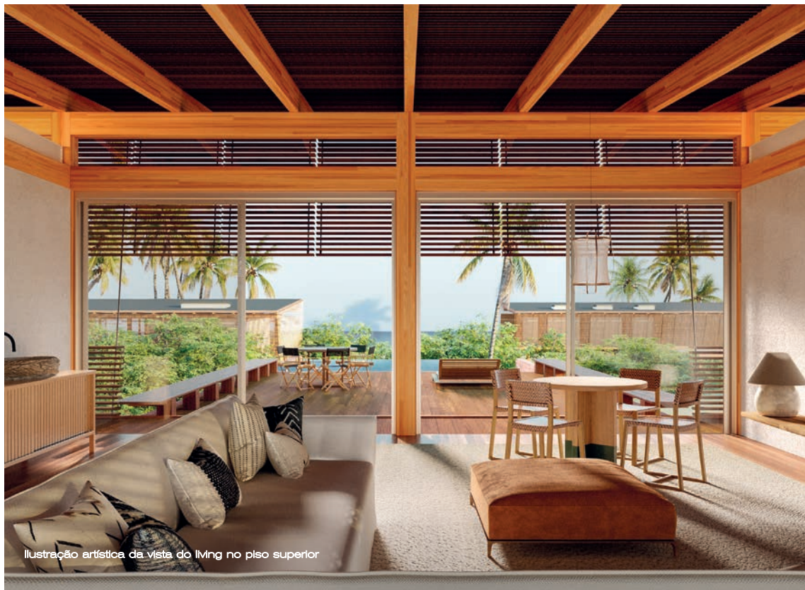
Ilustração artística da vista do living no piso superior