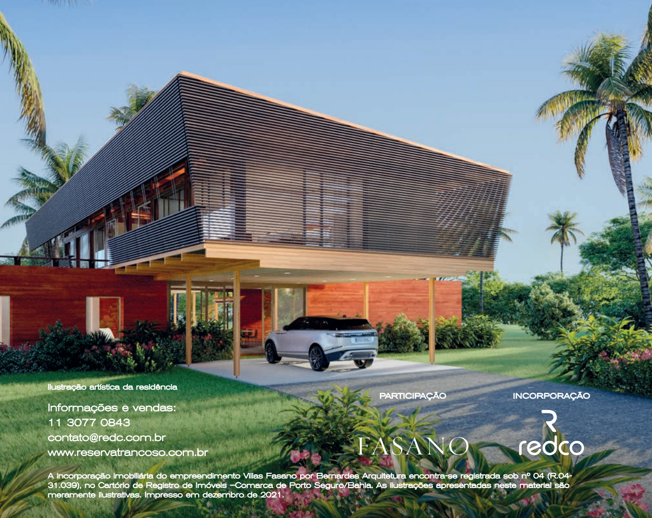
Ilustração artística da residência